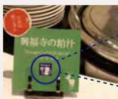
※メニュー札イメージ