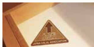
客室内の机の引き出しの中に設置