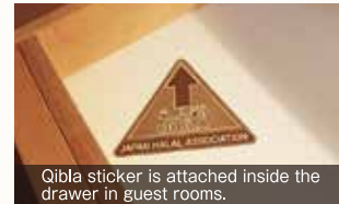
Qibla sticker is attached inside the drawer in guest rooms.