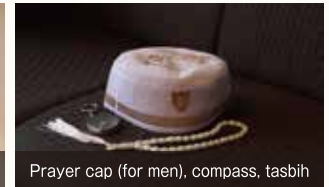
Prayer cap (for men), compass, tasbeih