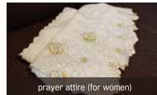
prayer attire (for women)