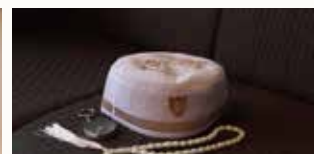
礼拝帽(男性用)、コンパス、タスビー