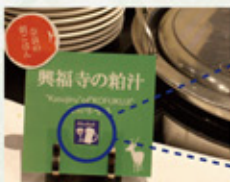
※メニュー札イメージ