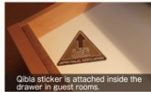
Qibla sticker is attached inside the drawer in guest rooms.