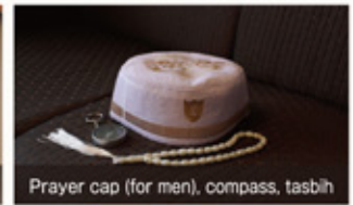
Prayer cap (for men), compass, tasbih