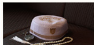
礼拝帽(男性用)、コンパス、タスビー