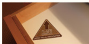
客室内の机の引き出しの中に設置