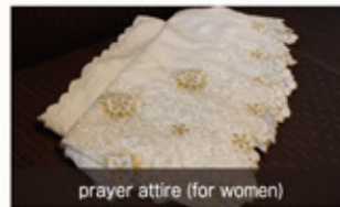
prayer attire (for women)